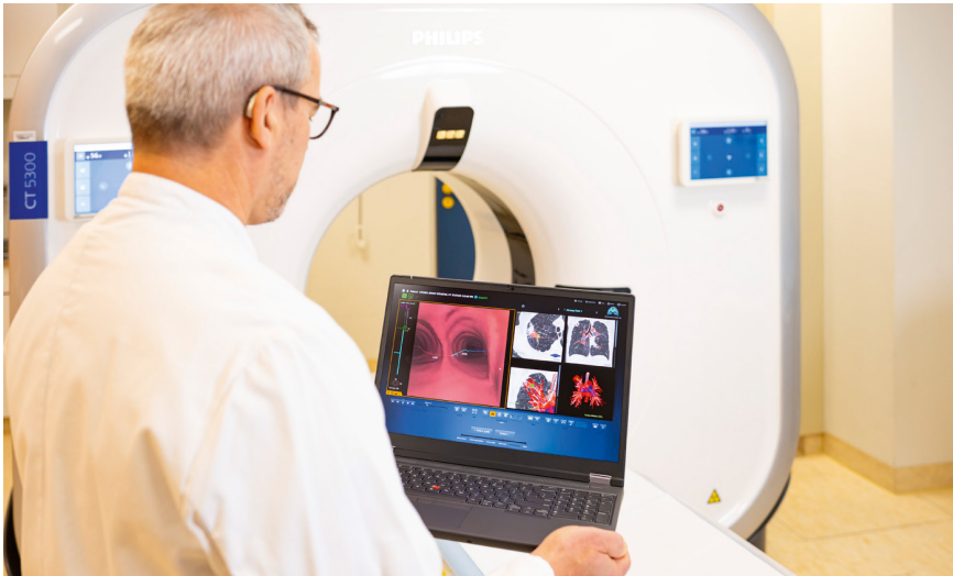
Die Diagnostik von in der Vorsorgeuntersuchung auffälligen Lungenherden wird durch digitale Navigationsverfahren wie der virtuellen Bronchoskopie optimiert

Um die langfristige optimale Betreuung der onkologischen Patienten kümmern sich im Gesundheitszentrum Wetterau die Onkologinnen und Onkologen im Facharztservicezentrum des Hochwaldkrankenhauses.